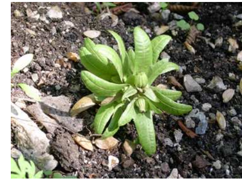
frutto di carpino bianco